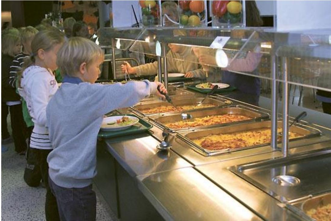
٢ الوجبة المدرسية في فنلندا

كلية. وليس هذا وحسب، بل أيضا هناك الوجبات المجانية والرعاية الصحية والمواصلات. وتشير الوكالة الفنلندية للتربية (National Agency for Education، ٢٠١٨) إلى أن الدولة تدعم الوالدين ، وتدفع لهم حوالي ١٥٠ يورو شهريًا لكل طفل حتى يبلغ ١٧ عامًا، كما توفر المدارس الطعام والرعاية الطبية والإرشاد وخدمة سيارات الأجرة إذا لزم الأمر.